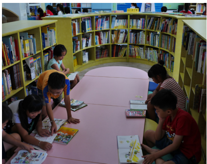
閱海方舟書櫃完工後學生更樂於沉浸書海中。