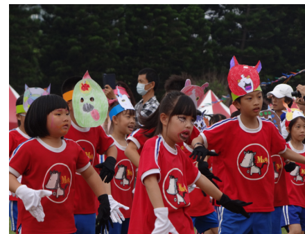
運動會一年級創意進場造型活潑可愛。