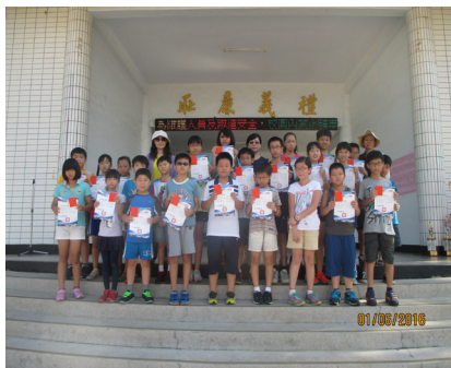
校內英語單字王檢測通過頒獎合影。

國內腸病毒疫情處於流行期，目前社區主要流行病毒為克沙奇A型，雖持續檢出腸病毒71型個案，疫情主要為輕症。疾