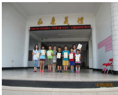
全縣英語讀者劇場比賽榮獲優等佳績。