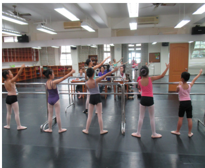
舞蹈班入學鑑定考試。