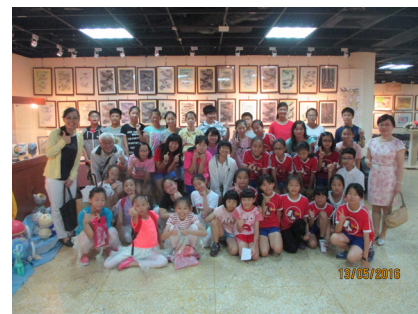
藝術與人文教學深耕靜態成果展開幕--大合影。