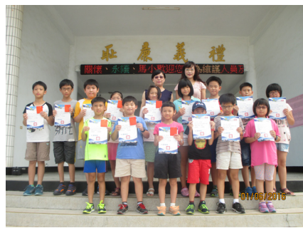
中年級硬筆字比賽優勝同學。

管署本年迄今共接獲2例未足月新生兒感染腸病毒，分別為克沙奇病毒A10型與腸病毒71型，所幸均為輕症且皆已出院。根據疾管署監測資料顯示，第20週（5月15日至21日）全國門、急診腸病毒就診人次共計19,312人次，較前一週上升13%。今年迄今共通報51例疑似腸病毒重症，3例為腸病毒71型確定病例、17例檢驗中、31例排除。