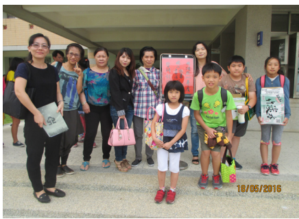
全縣硬筆字及書法比賽榮獲佳績。