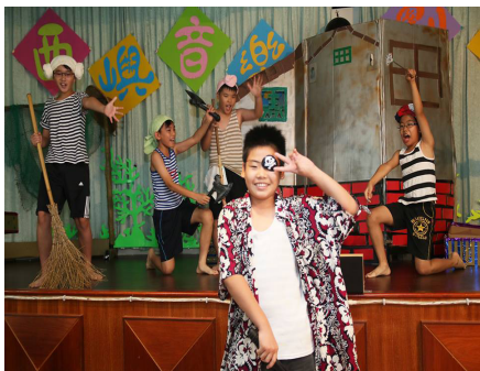
音樂班受邀至西嶼鄉表演「音樂劇-聚」。