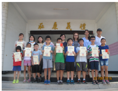
全縣科學玩具及科展獲獎合影。