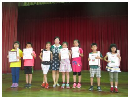
中華郵政全國兒童寫信比賽獲獎同學。