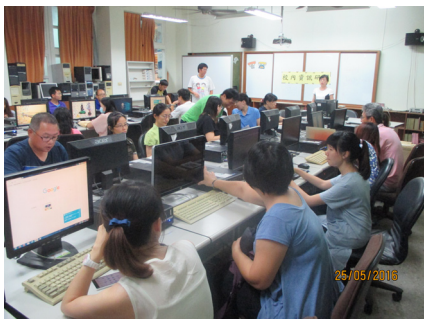
教師參加資訊研習。