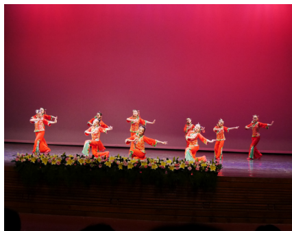
音舞班成果展五年舞蹈班-歡慶戲鼓舞太平。