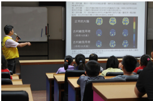
5月22日警察局派員到校進行反毒宣導-六年級。

腸病毒傳播途徑以糞口傳播為主，或是與病人密切接觸時感染。一般潛伏期為2到10天，其中約50%至80%感染者沒有症狀，有些只有發燒或類似一般感冒症狀，只有少數會引起高燒、咽喉腫痛、倦怠、全身酸痛不適、以及口腔多處潰瘍、四肢出疹。若家中幼童出現發燒、嘔吐、疱疹性咽峽炎或手、足、口出現小紅疹或水泡等疑似腸病毒症狀時，應立即就醫診治並減少出入公共場所，持