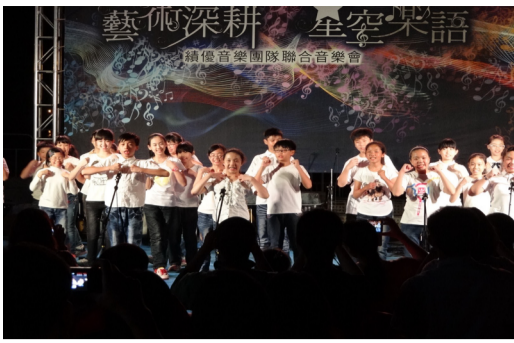
5月30日本校音樂班管絃樂團合唱團參加藝術深耕，星空樂語戶外音樂會。