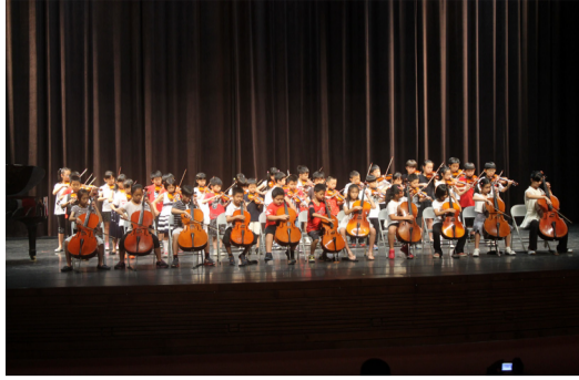
5月22日本校參加藝術深耕成果發表會。