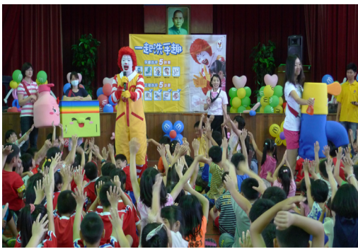
麥當勞洗手宣導，學生熱烈參與。

(一)請小朋友特別留意交通安全，走路時勿任意穿越馬路，尤其是騎單車時，必要之安全防護器具一定要配帶。