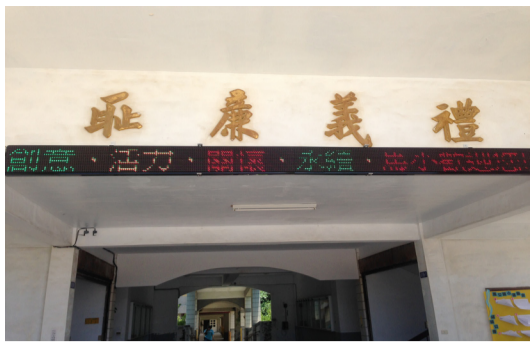
司令臺裝設LED燈，以便政令宣導及傳達資訊。