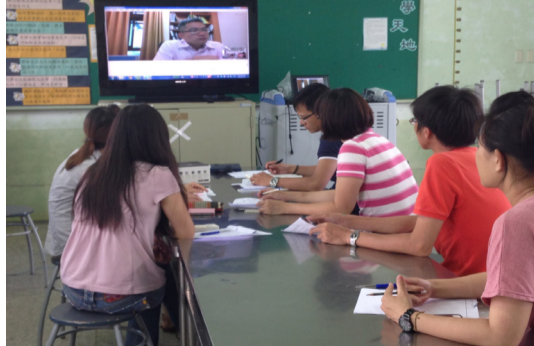
本校行動學習結合閱讀推廣，與中央大學張立杰教授遠距視訊研討。