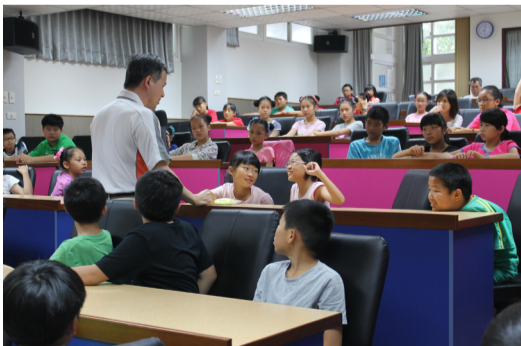
5月29日警察局派員到校宣導校園預防犯罪-五年級