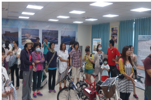
5月14日週三進修教師赴澎科大進行能源教育參訪研習。