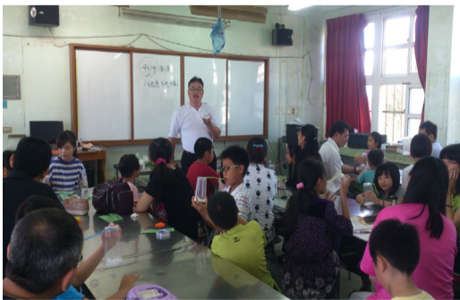
5月17日辦理中年級親子科學營活動，親子參與情形熱烈。