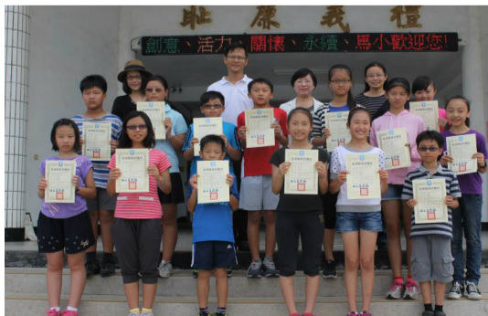
本校參加科展，榮獲佳績，獲獎同學於學校表揚合影。