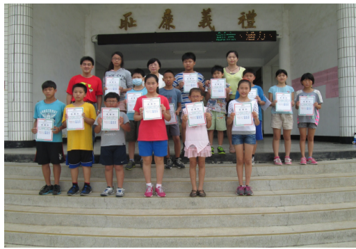
家扶中心主任至校頒發感謝狀與同學合影。

(二)居家請留意門戶、守望相助，外出不落單。避免孩子於意外事件發生高頻率時段外出，包含：晚上入夜後、清晨七點前。