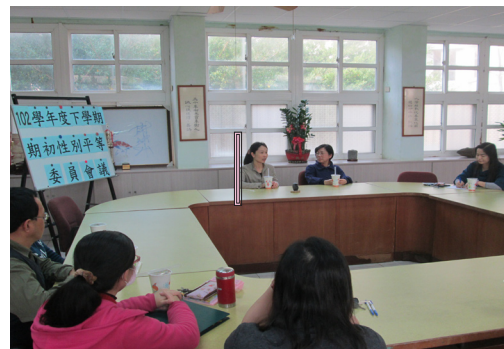
102學年度第二學期期初性別平等委員會會議。