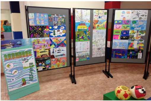
本校於色彩教室佈置學生寒假作業展。