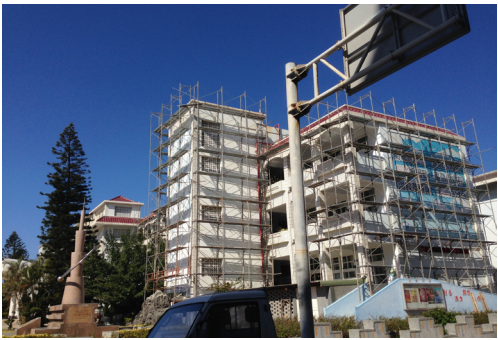
校園施工拆除紅色屋瓦。