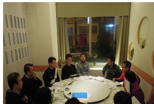
本校家長會召開期末家長委員會會議。