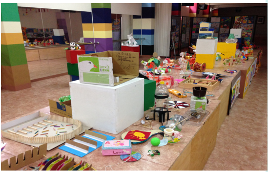
本校寒假作業展科學玩具顯現學生創造力。

台灣屬亞熱帶氣候，一年四季皆可能感染腸病毒，甚有導致嚴重併發症而死亡的腸病毒重症案例。近來又出現高峰期，提醒家長隨時警惕自己、幼童與所有家人，加強良好衛生習慣的落實，增強自身免疫力，避免疫病上身。 一、預防腸病毒感染方法 1. 落實洗手正確五步驟：「濕、搓（手心手臂搓20秒）、沖、捧、擦」。洗手五時機：吃東西前、看病前後、跟弟妹玩前、上廁所後、擤鼻涕後、遊戲後、回家後。 2. 注意「呼吸道及咳嗽禮節」，家中應備妥適量口罩，以防不時之需。 3. 落實「生病不上學」的防疫觀念：如有身體不適的狀況，應儘速就醫，並讓學童請假，並告知班級導師病情，自醫師確診日開始執行自我健康管理一週，以避免將病毒傳播給他人，並讓自己儘快恢復健康。 4. 定期進行環境清潔及重點消毒，並注意居家環境衛生通風。 5. 流行期間請避免出入公共場所，以防感染腸病毒。 二、消毒方法 1. 以500ppm含氯漂白水擦拭常接觸之物體表面、地面、玩具、門把、遊樂設施及書本。 2. 泡製方法：取市售家庭用漂白水（免洗湯匙5瓢）+10公升（8瓶大寶特瓶）清水即為500ppm 三、腸病毒感染併發重症 若幼童經醫師診斷感染腸病毒時，要注意病人是否出現腸病毒感染併發重症前兆病徵，例如： 1. 「持續發燒、嗜睡、意識不清、活力不佳、手腳無力」。 2. 「肌抽躍（無故驚嚇或突然間全身肌肉收縮）」。 3. 「持續嘔吐」與「呼吸急促或心跳加快」等。 一旦出現上述病徵，請務必立即送大醫院接受適當治療，以免錯過治