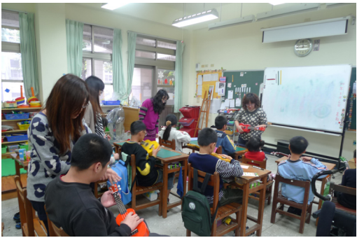
全腦班烏克麗麗教學課程開發聽觸覺感受力。