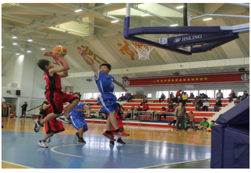
首長盃籃球隊選手比賽實況。