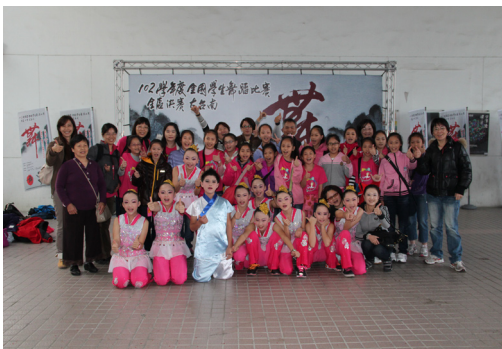
五舞六舞參加102學年度全國舞蹈比賽。

教務處未來許多重要訊息，將持續與臉書社團「馬公國小教務處資訊公開處」同步更新，歡迎大家蒞臨瀏覽。可登入臉書後蒐集社團，或者直接登打網址 https://www.facebook.com/