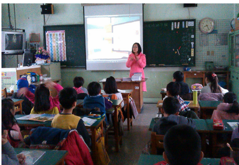
各班級進行反霸凌影片宣導。