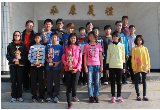
103年中小聯運選手獲佳績，獲獎小朋友與校長合照留影。