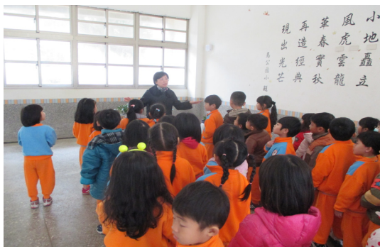
3月11日耕讀幼兒園來訪—校長熱切帶領說明。