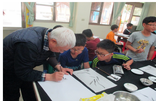
藝術深耕--水墨畫學習。