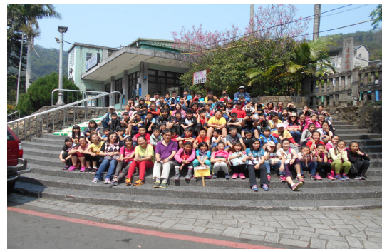
本校六年級畢業生畢業參訪—內灣車站。