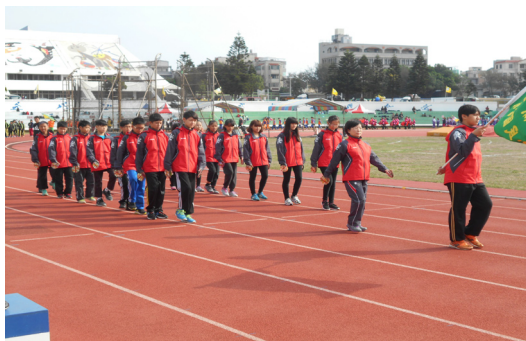
3月13日中小學聯合運動會本校運動員精神抖擻進場。