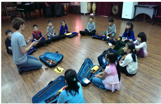
本校二年級中、小提琴班上課情形。