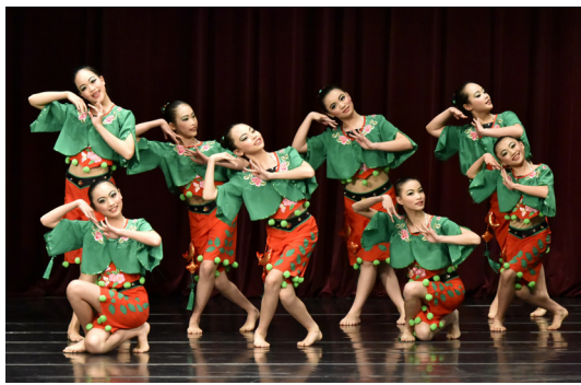
3月8日全國舞蹈比賽，溪戲(民俗舞)榮獲優等。