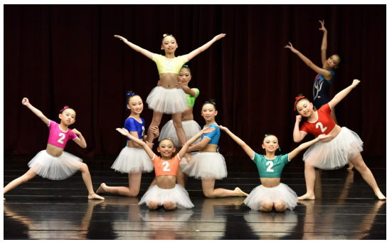
3月9日全國舞蹈比賽，Physical狂想曲(現代舞)榮獲甲等。