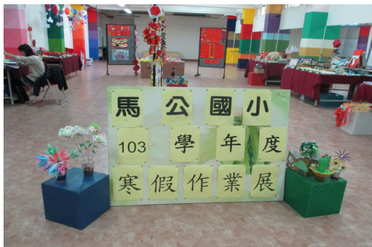
本校寒假作業展覽。