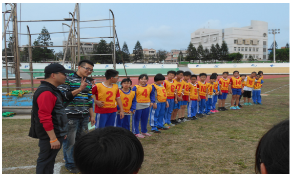
五年三班參加全縣樂樂棒球比賽。