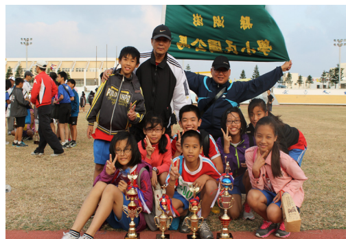
本校田徑選手在教練群辛勤的指導下，獲得多項獎項，開心地與校長合影，留下美好回憶。