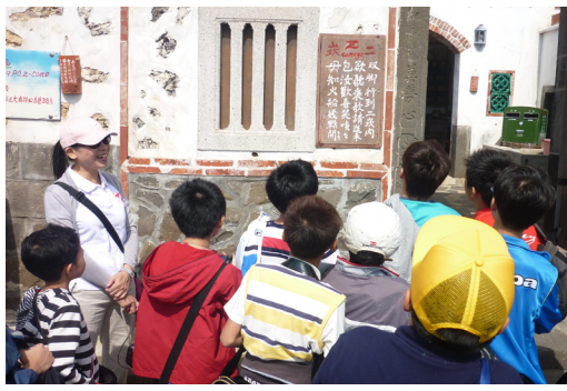
本校參加校本資優「藝術才能」教育方案小朋友，赴二崁褒歌館聆賞澎湖褒歌文學與藝術。