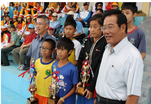
本校田徑選手於縣運比賽榮獲佳績，獲獎小朋友與王縣長合照留影。