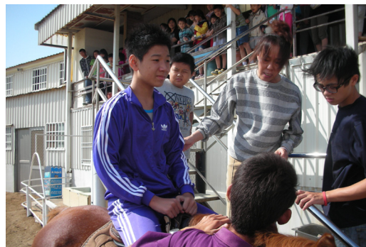
101年度身心障礙者親師生心靈饗宴研習活動一我是勇敢小騎士！