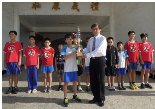
本校籃球隊在教練群辛苦指導、學生認真練習下，勇奪縣運籃球比賽國小男生組冠軍。