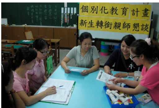
各班老師與家長進行雙向互動，促使親師之間可以幫助孩子在學校學習或生活上更適應、更快樂。

11月23日(五)全國學生舞蹈比賽，將由五、六年級舞蹈班同學代表本校參加，請家長及師長們給予加油打氣，期許獲得佳績。