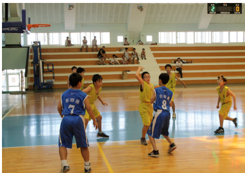
本校籃球隊選手於縣運比賽總決賽中奮力一戰。