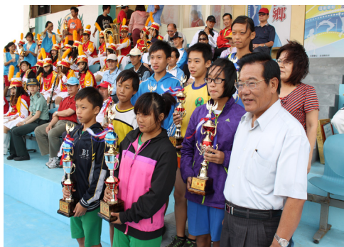
本校田徑選手於縣運比賽榮獲佳績，獲獎小朋友與王縣長合照留影。

人與人之間的溝通方式是多樣的，除了面對面的直接接觸外，亦可採用間接的方式，求得彼此各方面的交流。輔導室為協助學童克服切身困難，