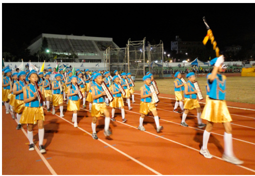
本校樂隊穿著亮麗制服、踏著整齊步伐引領運動選手進入會場。