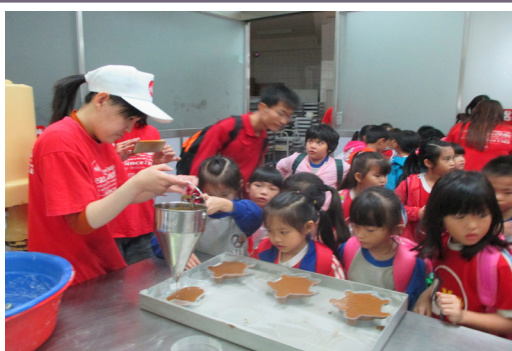
一年級小朋友校外教學，參觀黑糖糕製作。