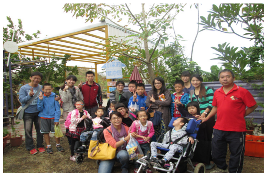
全腦開發班校外教學參觀東衛小茉莉，一起開心合影。

預防方法：經常洗手可以降低感染的機會，飯前便後及烹調食物前皆應洗手。儘可能熟食及飲用煮沸的開水，而病患之糞便及嘔吐物應小心處理，清理後也應洗手。大部分的病毒尚無