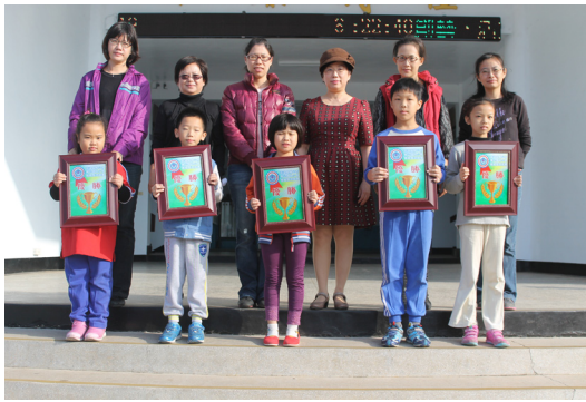
整潔比賽獲獎班級上臺頒獎合影。

疫苗，但目前市面上已有輪狀病毒疫苗，若家有幼兒可諮詢小兒科或家醫科醫師後考慮接種。