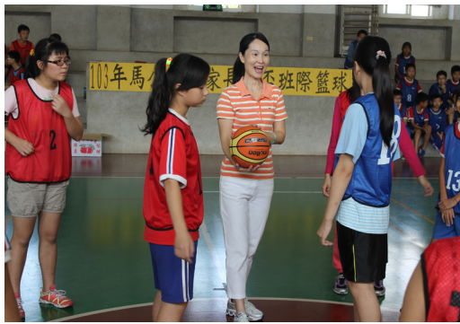
103年家長會盃班際籃球賽，于會長蒞臨現場開球。