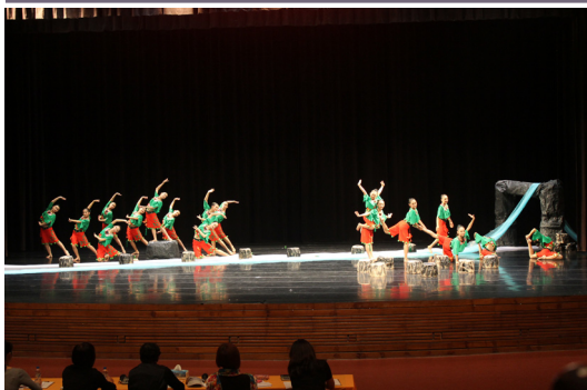
全縣舞蹈比賽，六舞學生參加民俗舞比賽，榮獲特優佳績。

三. 澎湖縣青少年交響樂團於11月20日正式成立，由本縣熱愛音樂的師生共同組成，整合縣內現有樂器、演奏師資及人才。目前團員約80人，有超過半數為本校音樂班學生，其中指導老師約計有20位，也多為本校音樂班兼任教師群與畢業校友，盼能「大手牽小手」精進所學，彼此成長茁壯、蓬勃發展。