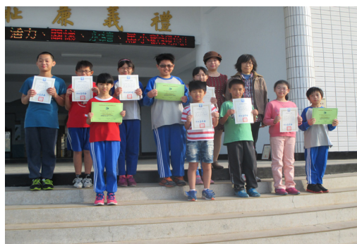
全縣英語歌唱比賽榮獲優等頒獎合影。