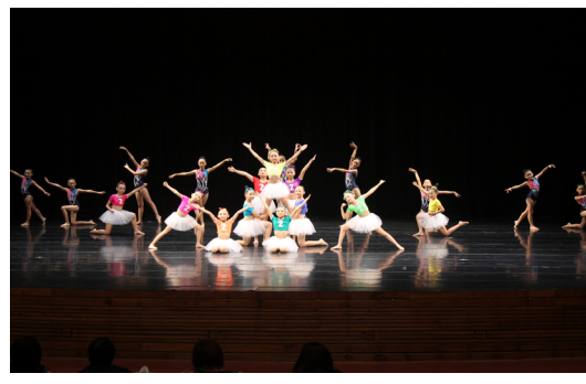
全縣舞蹈比賽，四、五舞學生參加現代舞比賽，榮獲優等佳績。