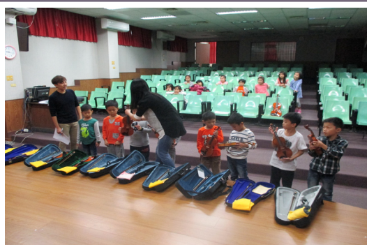
藝術深耕課程，老師指導小朋友樂器使用方法。