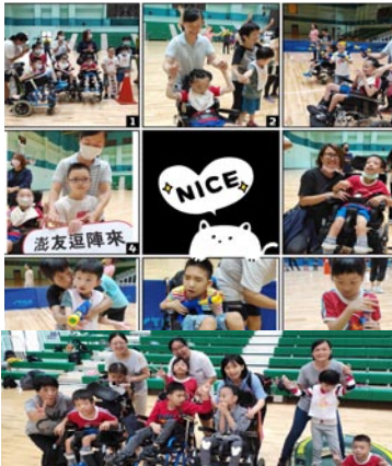
身心障礙趣味競賽