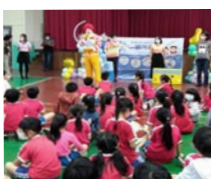
麥當勞叔叔洗手宣導