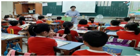
校長指導一年級學生閱讀