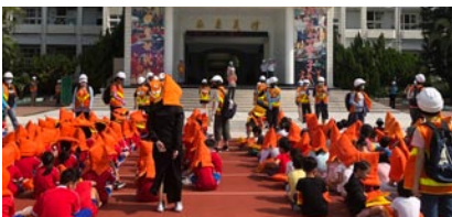
地震暨海嘯防災教育演練

六、舞蹈班赴台參訪暨演出行程於10月16日圓滿完成。第一天前往嘉義市崇文國小舞蹈班進行交流，在這裡我們受到如貴賓般的禮遇，也和崇文國小舞蹈班6年級的學生一起上課，時間雖然短暫但第一次的交流接觸令人難忘。接著到嘉義女中觀賞大姊姊們為馬公國小舞蹈班特地演出年度發表會的舞碼，姊姊們的熱情及精湛的舞技，讓我們留下深刻的印象。第二天及第三天分別到嘉義縣新塢國小、中和國小進行「109年好優show藝團活動一元宵乞龜趣澎湖」表演。在不熟悉的場地表演，臨場應變很重要。音樂、道具、換衣服的地方、場地的布置與清潔，都要在很短的時間內安排妥當，三天行程雖然累，但不論老師或學生都收穫滿滿。有了這次經驗的積累，相信參與這次活動的孩子們增加了更多的能量與臨場應變的能力。