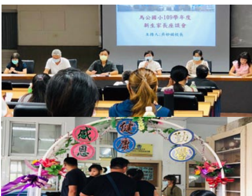
新生家長座談會--歡迎您和寶貝一起加入「馬小大家族」