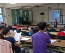
班親會高度近視宣導