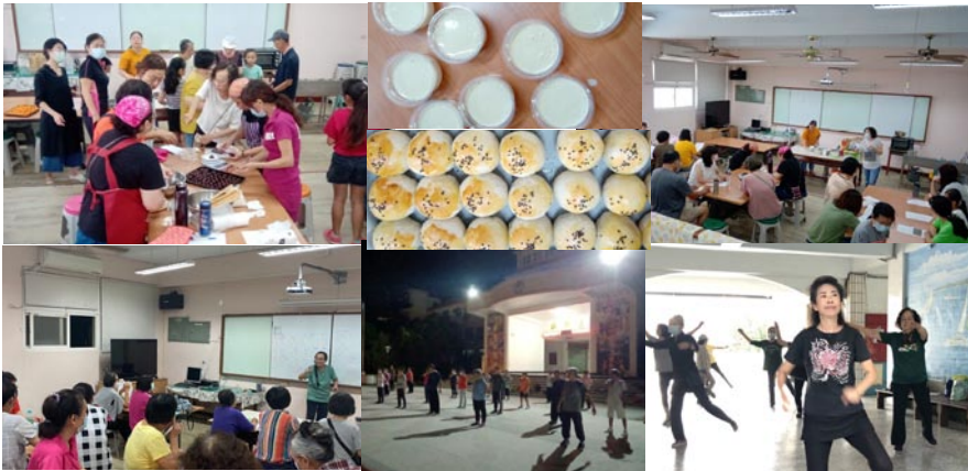
109社區多功能中心活動--烘焙、日語班、太極拳養生班、烘焙(烹飪)