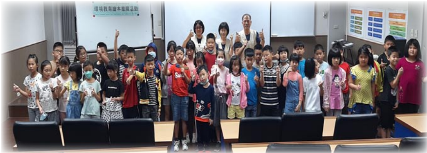
環保局環境教育繪本推廣計畫活動