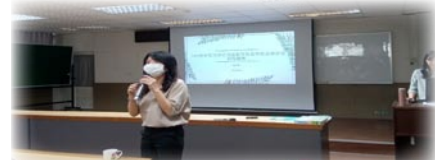
109英語領域到校輔導