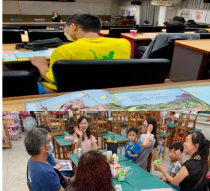
「用心學習·快樂成長」親師座談