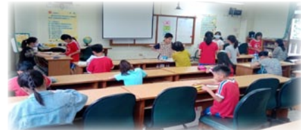
1090925辦理學生英語認證活動