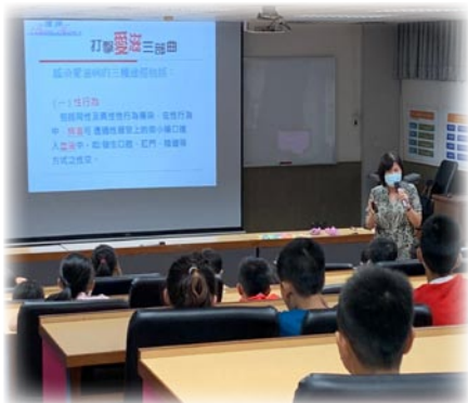
四年級性教育暨愛滋宣導