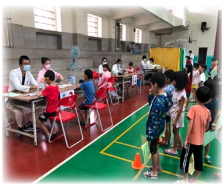
本年度學生健康檢查