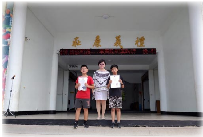
109全縣經典會考獲得甲組第一名