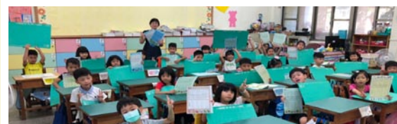
縣府贈一年級學生桌墊