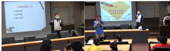
毒品及網路校園霸凌法治教育宣導--陳建佑檢察官主講