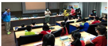
統一發票推行暨租稅教育宣導