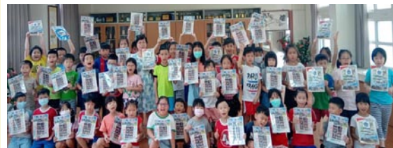
校長獎勵通過經典會考學生