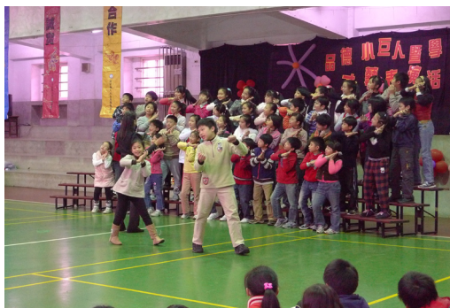
上學期期末辦理學生才藝表演。