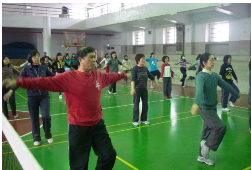
校內研習一教師健康操研習。