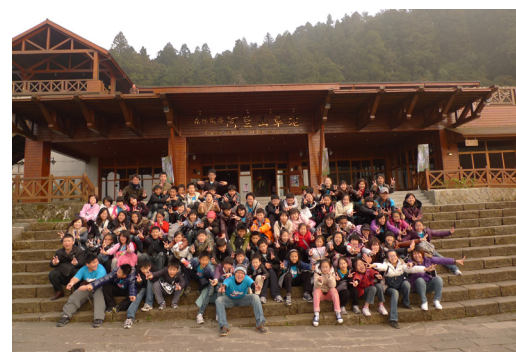
本校六年級畢業生畢業參訪—阿里山賞櫻觀日出。

置物櫃能收拾整潔。4.會把垃圾丟到垃圾桶；並自動撿拾座位附近的垃圾。5.會做好垃圾分類。