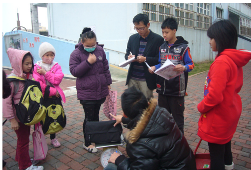
本校實施書包抽測，針對書包超重學童進行宣導。