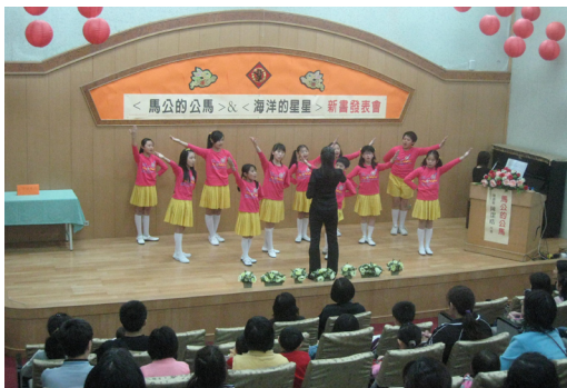
本校音樂班參加文化局新書發表會暖場表演。

一、若為B型肝炎感染高危險群（血液透析病人、器官移植病人、接受血液製劑治療者、免疫不全者；多重性伴侶、注射藥癮者；同住者或性伴侶為帶原者；身心發展遲緩收容機構之住民與工作者；可能接觸血液之醫療衛生等工作人員…），可自費追加1劑B型肝炎疫苗，1個月後再抽血檢驗，若表面抗體仍為陰性（<10mIU/ml），可以採「0-1-6個月」之時程，接續完成第2、3劑疫苗。如經此補種仍無法產生抗體者，則無需再接種，但仍應採取B型肝炎之相關預防措施，並定期追蹤B型肝炎表面抗原（HBsAg）之變化。