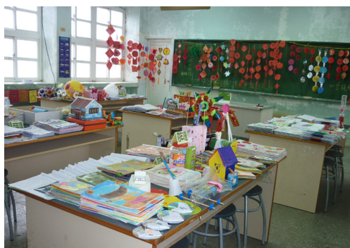
本校寒假作業展覽。

低年級： 1.每天能按時完成功課。2.能自己收拾整理使用過的物品。3.自己的抽屜