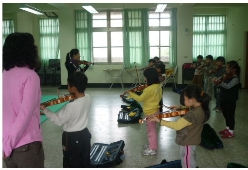
本校二年級弦樂基礎養成班上課情形。