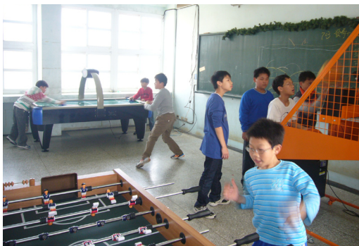
本校樂活運動站已經開放使用，同學們反應熱烈。