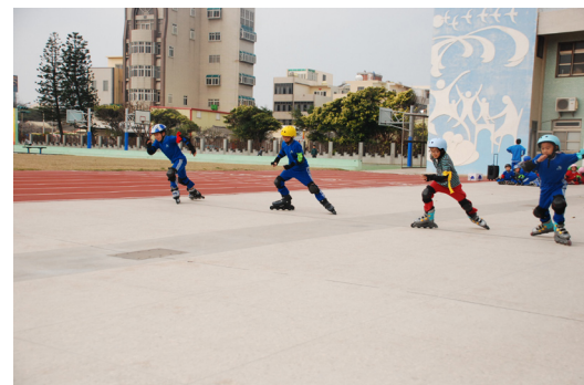
本校辦理慶祝兒童節直排輪競速比賽。