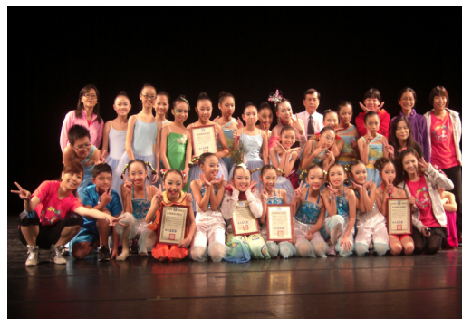
恭喜本校獲101學年度全國學生舞蹈比賽團體組優等及甲等佳績。