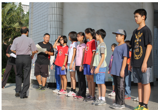
異程接力賽轉頒獎與獻獎。