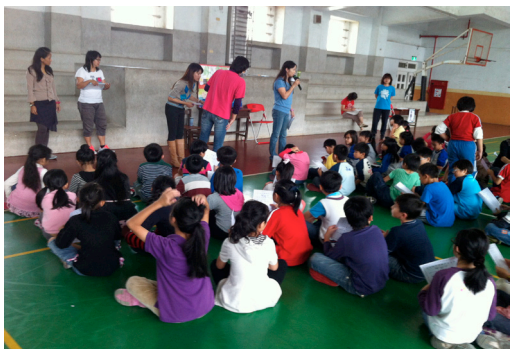
本校三年級小朋友參與「生命教育體驗營」闖關活動。