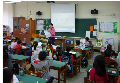
本校一年級於期中考生活課程以影片方式進行，落實多元評量精神。

🎅感謝各位家長配合汽機車分流措施，使得我們東側門可以更加順暢。但若遇下雨天時，懇請各位家長也可以多多利用北側門進入校園。同時也請家長為了其他孩子的安全，請勿將汽機車由西側門進入校園，可以請孩子在校門口下車。感謝各位家長的體諒與合作。