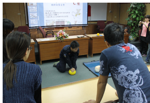
本校週三教師進修參與CPR急救訓練課程。