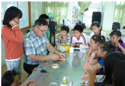
本校利用假日邀請未來少年雜誌專欄作家蒞校進行科學實作教學。

🎅近期天氣不穩定，導致溜冰社團多次停課，深感抱歉，爾後溜冰社團上課時間如遇下雨，我們考量安全因素，會以停課處理，所遺留上課之次數，會於期末或寒假的時間給予補齊，屆時另行通知補課時間。