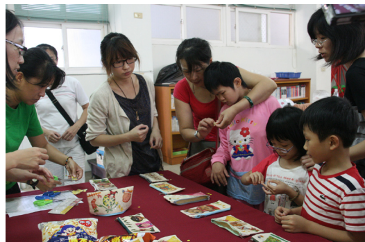
家庭教育活動～親子DIY蝶古巴特成果票選。