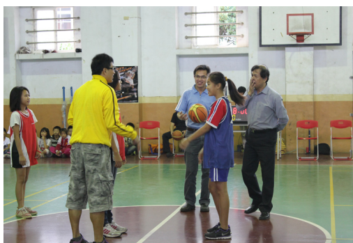
家長盃籃球賽特別邀請家長會歐會長主持開球典禮。