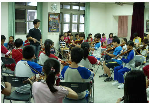
藝文弦樂深耕課程—本校二年級小朋友至合奏教室欣賞音樂班管絃樂團演奏。