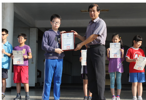
桌球隊小朋友將團體獎狀獻給學校。