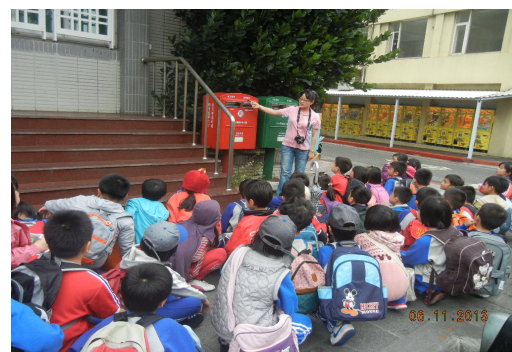
二年級校外教學——中華郵政。