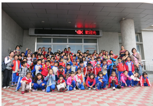
一年級校外教學——種苗養殖場。

❄️ 今年度萬聖節英語對話活動於10月25日第2節課展開，不同年段的學童必須完成不同難度的英語對話內容，向科任關主教師領取糖果，小朋友參加