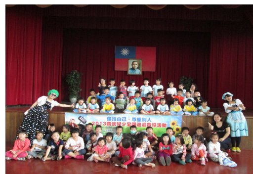
純潔協會至本校進行家暴宣導。