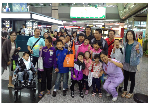
全腦開發班親師生校外教學參觀航空站。