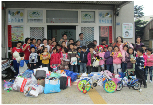
本校輔導主任帶領小朋友送愛心到家扶。