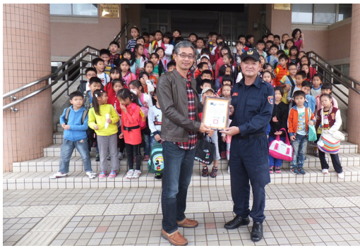
三年級校外教學—消防局。