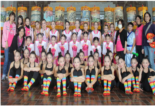
本校舞蹈班獲102學年度全國學生舞蹈比賽團體組優等及甲等佳績。。