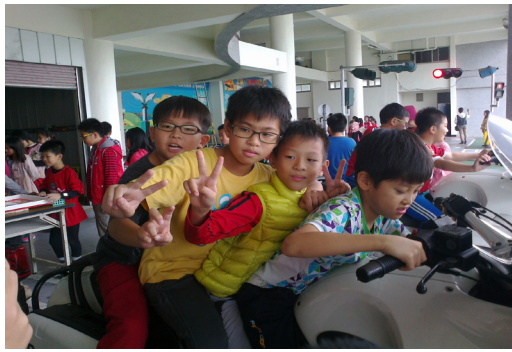
四年級校外教學—澎湖縣交通隊。