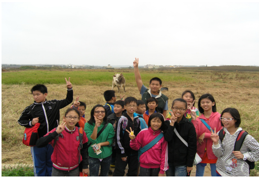
六年級校外教學—環保局環境教育。

訣」，1記：保持冷靜記住動物特徵、 2沖：大量清水、肥皂沖洗傷口並用優碘消毒、3送：儘速送醫評估是否打疫苗、 4觀：儘可能將咬人動物繫留觀察十日。