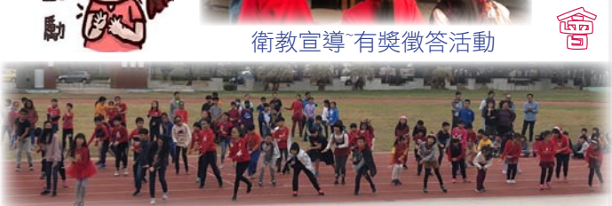
愛心玩遊會～舞蹈快閃活動

五、本校於12月4、5、6日，師生順利參加108學年度澎湖縣音樂比賽暨師生鄉土歌謠比賽。