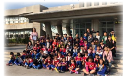
文化局及海洋資源館