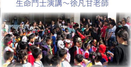
萬聖節舞蹈快閃活動