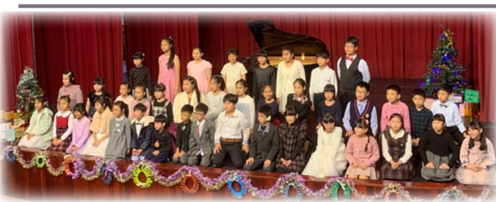
實習音樂會～音為有你

九、縣長為關懷特殊需求學生，特地於12月3日-國際身障者日當天，假順成餐廳舉辦「與天使有約」活動，孩子們的笑容、抽到摸彩品的興奮，溢於言表。