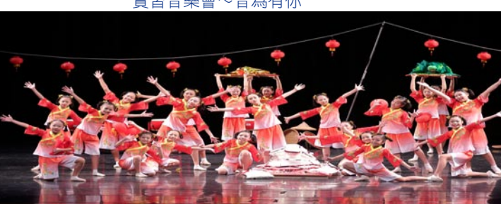
全縣舞蹈比賽～國小A團體乙組民俗特優