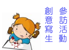
參訪活動 創意寫生