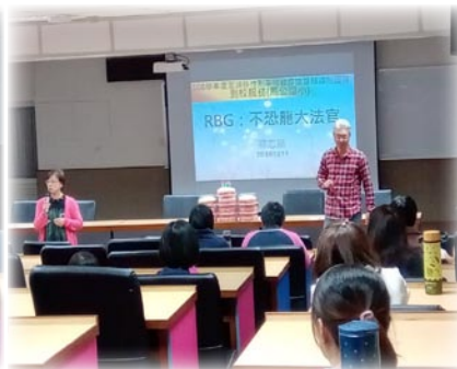
性別平等教育到校輔導