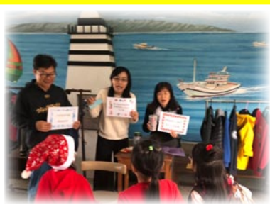
衛教宣導～有獎徵答活動