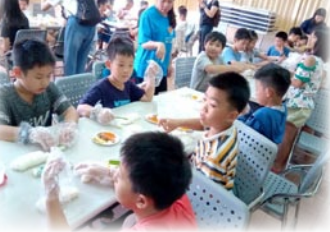
體驗教育～親手做握壽司