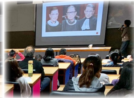
性別平權與司法改革影片研討