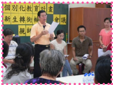
家長參與個別化教育計畫、新生轉銜輔導及親師家長座談會

特教班於9月29日（五）下午召開「個別化教育計畫」、「新生轉銜輔導」暨「親師家長座談會」，家長對於馬小特教班老師非常有信心，也提出許多建議事項，整個活動進行相當熱絡，感謝各位家長對特教的支持，謝謝特教班老師的用心，馬小的特教會愈做愈好！