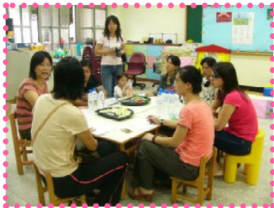
名班與家長討論個案IEP

特教組於10月4日（三）進行全校教職員工建構無障礙校園學習環境--對於身心障礙學生之接納與宣傳，並希望老師能於班上多多宣導、並鼓勵小朋友多接觸身心障礙的小朋友，她們是一群可愛的小天使喔！