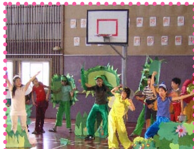
本校六年級音樂班演出「三隻毛蟲闖天下」之音樂劇