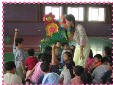
黃玉倩老師與小朋友進行有獎徵答