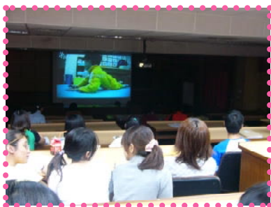
影片觀賞：大衆男孩與機器女孩