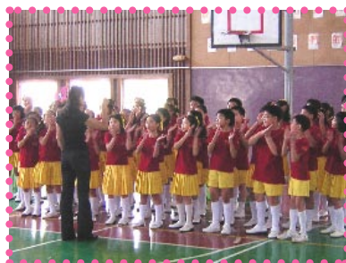
本校音樂班小朋友表演合唱

本校直笛團已於近期展開本學期的練習。直笛隊成立已五年，在許多老師們的熱心指導下，小朋友都有進步。所以，鼓勵中、高年級有興趣的同學有恆心的練習技巧，有了基本技術，就能樂在其中；許多畢業學長們在直笛隊中學會了高音笛、中音笛、低音笛等的吹奏方法，都覺得受用無窮。小朋友們加油！