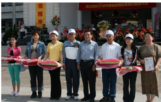
表揚本校閱讀及服務志工。