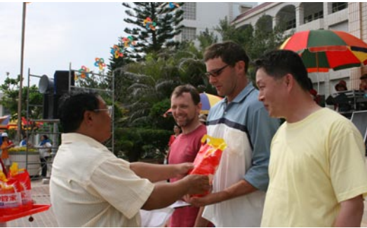
楊督學頒獎予家長及教師大隊接力獲獎選手。