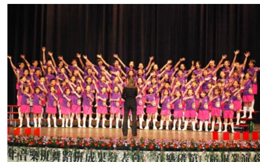
音樂班、舞蹈班96學年度成果展暨赴福建交流的行前公演—合唱表演。