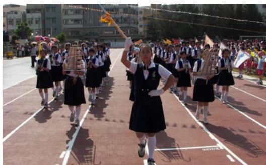
本校直笛節奏樂隊擔任運動會會旗前導及運動會典禮奏樂。