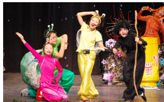
本校音樂班六年級的演出：兒童音樂劇—阿毛搬新家。