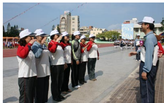
表揚本校導護服務志工。