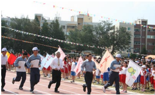
校長帶領全體來賓繞跑操場啟用跑道。

❤ 【一起向登革熱說NO！】時序入春，氣溫回暖，又將是病媒蚊易繁殖的季節，積水容器如花瓶、冰箱底盤、廢輪胎及廢容器等，極易形成登革熱病毒及病媒蚊傳播有利之條件，為杜絕登革熱孳生源媒介，需仰賴大家一起行動，一起向登革熱說NO，共創健康美好的環境。「清除登革熱病媒蚊孳生源自我檢查表」可於環保局網站下載使用( http://www.phepb.gov.tw )。