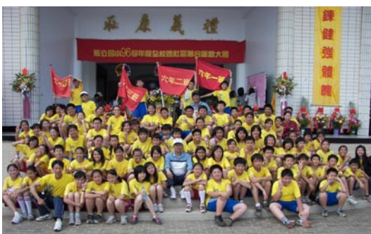
本校六年級全體師生與校長大合照。