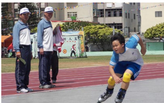
直排輪表演賽之火速小子。