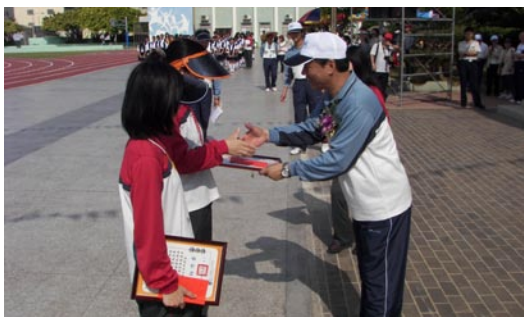
在校服務十年的教師接受表揚，並由校長頒獎。