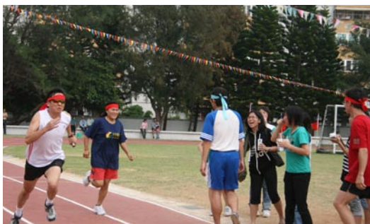
運動會小朋友們最期待的項目—家長及全校教師大隊接力。

聲和淚水，驗證了生命無窮的潛力與希望。或許您家中並沒有自閉症的孩子，但我們相信他們也需要被用心灌溉、教導、鼓勵與陪伴！有些自閉兒擁有許多獨特的潛力，或者應該說才華，這些孩子的生命，看似在一條漫長、昏暗的旅程上，毫無希望，卻都因為媽媽們全心的付出，他們成為夜空中最明亮的星星。