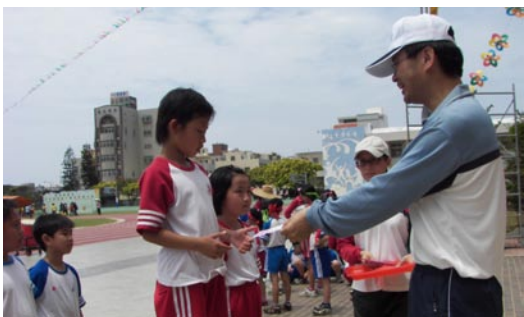
家長會鄭會長表揚競賽獲獎選手。