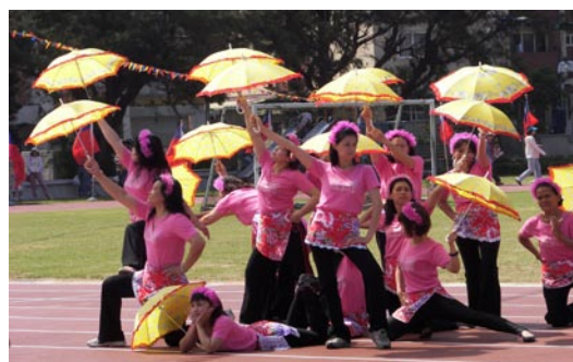
本校補校同學的賣力演出為運動會增添許多光彩。