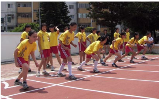
個人競賽-蓄勢待發。