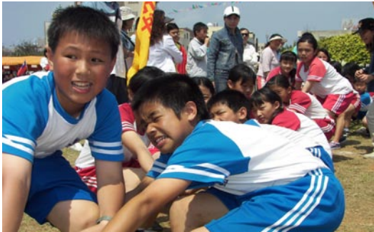
趣味競賽—力拔山河，小朋友賣力演出贏得觀眾熱烈的掌聲。