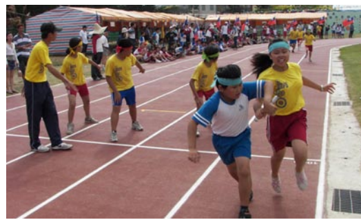
運動會最受矚目 賽一大隊接力，參賽者的賣力及一旁加油聲將運動會的氣氛帶到最高。