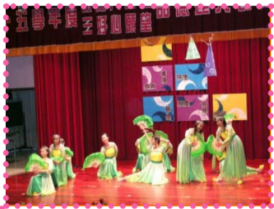
教師舞蹈團於品德達人表揚大會表演

本校舞蹈團隊於澎湖縣跨年晚會中參與演出，表演精采絕倫，博得在場觀眾滿堂采，感謝舞蹈訓練團隊老師們的辛勞。