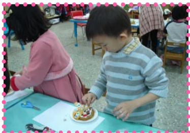
看我大顯身手，來個最酷最~special的造型！