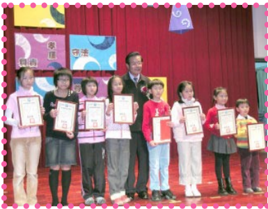
本校學生獲選全縣品德達人與縣長合影