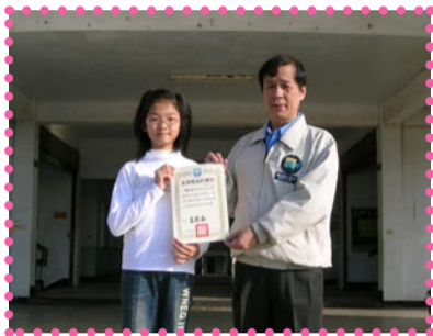
校長轉頒獎狀予得獎小朋友—合作教育書法比賽