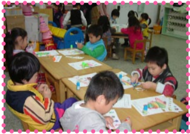
動動手，動動腦，為聖誕樹化個美美的妝