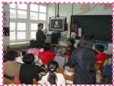
本校學生實施「毒害一生」影片宣導

寒假期間本校承辦全縣籃球冬令營：時間為2月5日~2月9日，上午8:30~12:00，下午13:30~16:10。對象為三~六年級，地點：馬公國小活動中心。