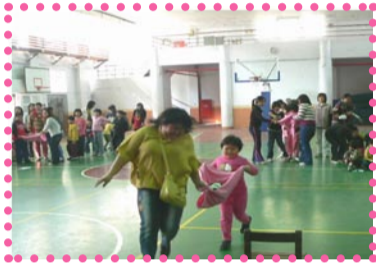
親子趣味競賽---有「球」必應

本校於12月26日（星期二）上午在學生活動中心舉辦「陪我成長歲暮佈新迎吉祥-----特教教學成果暨親子活動」，活動中在榮耀爺孫倆親子秀的氣氛帶動下，其他的小朋友、家長也不甘示弱地上場「《丫、一腳》，展現了最瘋狂親子秀；唱唱跳跳迎吉祥的帶動唱及親子趣味競賽也讓整個活動High到最高潮，全體師生及參與的家長們，在熱熱鬧鬧的氣氛下，大家提前度過一個歡樂又溫馨的新年。