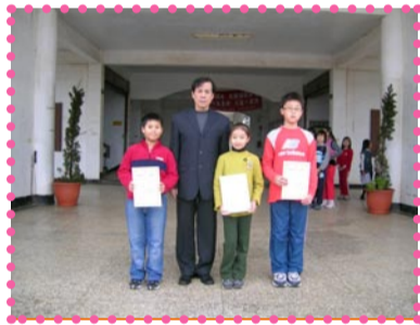
校長轉頒獎狀予得獎小朋友—書法比賽