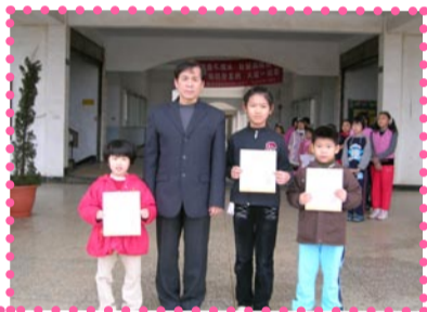
校長轉頒獎狀予得獎小朋友—繪畫比賽