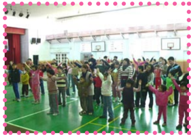
全體師生、家長，大家一起唱唱跳跳迎吉祥

本校12月22日於特殊教育資源中心綜合館會議室辦理「特殊教育助理人員專業研習」，邀請到官聖棠治療師主講—發展遲緩學童類別、照顧服務及生活衛教的實施。