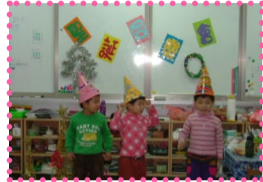
酷吧！這是我自己設計的喔！