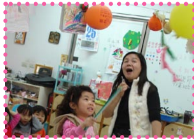
刺糖果大齊一小朋友們個個又怕又愛的表情真可愛

年級與六年級的「藝術與人文」學習成效評量；其中就音樂、視覺藝術、表演藝術三大內涵，分別實施「認知」與「實作」評量；目的在檢視九年一貫「藝術與人文」領域學習實施成效之外，並編製領域學習成效的標準化評量工具、建立學習成就資料庫及提供研究範例。