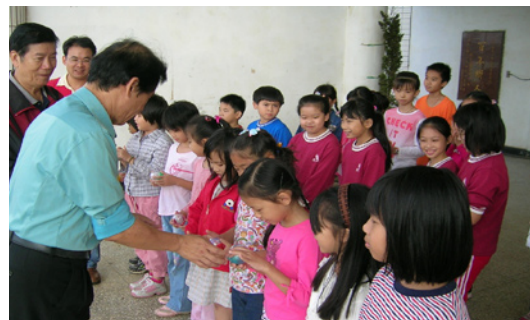
「扭轉奇蹟神秘蛋」閱讀小超人歡喜地接獲獎品。