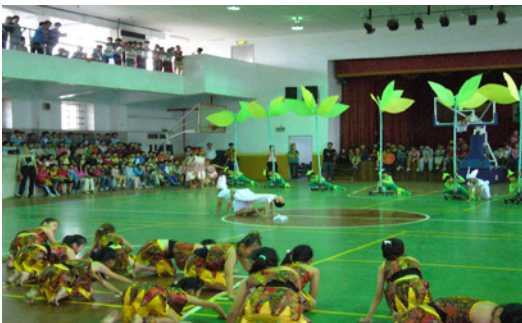
舞蹈隊的小朋友於學生活動中心進行彩排，全校師生到場為參賽的小舞者們加油打氣。