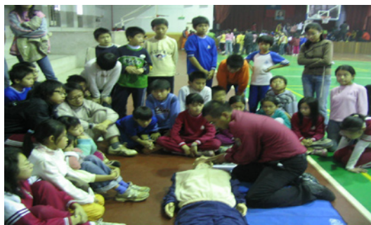
透過消防叔叔的示範，小朋友體會自救及救人的知識。

午8：00；週一、二、四、五下午16：00於活動中心進行比賽，請有興趣的家長前往觀賞。