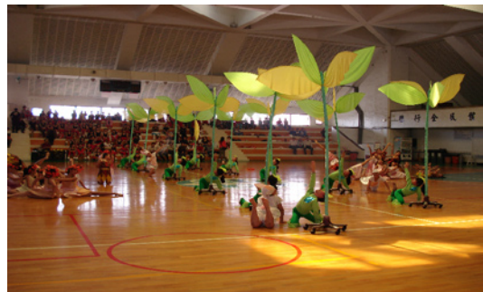
比賽當天小舞者們使出渾身解數，獲得優等佳績。