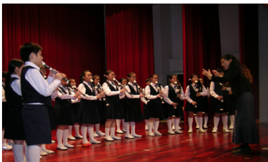
本校直笛隊參加全縣音樂比賽，學生們呈現平時練習成果。