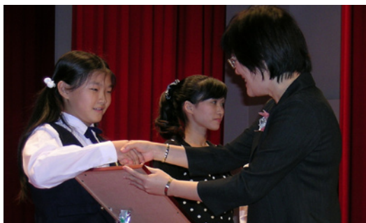
本校直笛隊獲得全縣音樂比賽直笛國小甲組優等第一。