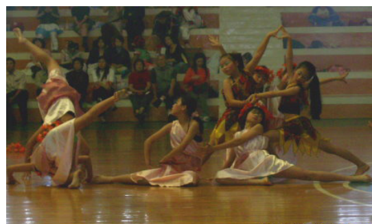
本校舞蹈團隊參加全縣舞蹈比賽，榮獲現代舞組優等第1名。