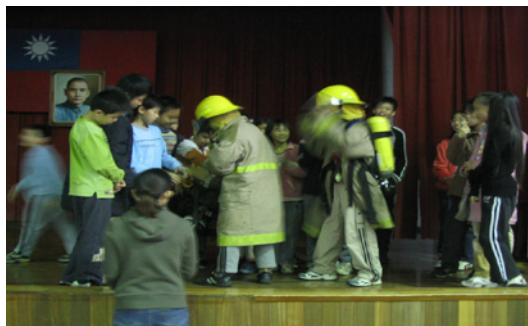
本校於活動中心辦理消防推廣活動，內容多樣，也讓小朋友對防災有更進一步的認識。