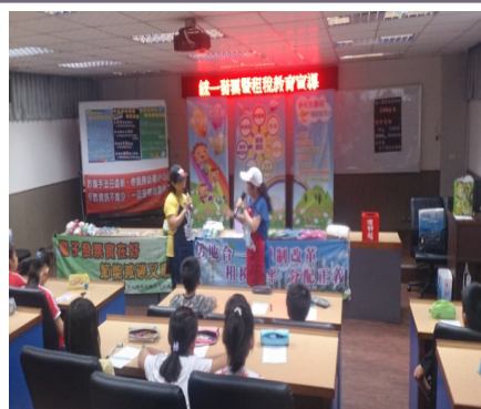
稅務局蒞校對六年級學生進行統一發票推行暨租稅教育宣導！