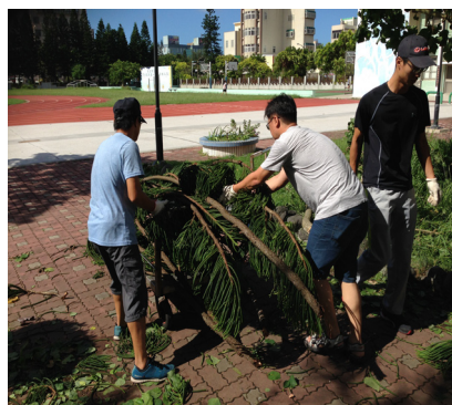
颱風過後，總務處人員和替代役辛苦的清理工校園斷落樹木。