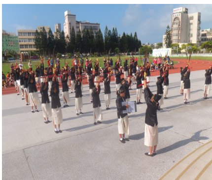
祭孔典禮六佾舞儀式校內著裝預演。

105年第6屆離島運動會在澎湖舉行，馬小舞蹈班受縣府邀請演出開幕大會舞。為了這全縣的盛大演出活動，舞蹈班小朋友從上半年起，就開始了表演節目的練習。暑假期間的暑訓排練，還加入了四年級及五年級插班的孩子，讓表演節目的陣容更加浩大，舞台呈現效果更加豐富、多變。此外，表演的道具，經過老師們及孩子的巧手加工後，讓平凡的風車在轉動時遠看就像澎湖縣的縣花——天人菊。感謝這一段時間裡協助《浪花花》的所有幕後工作人員，因為有大家的付出才能讓演出順利、圓滿！