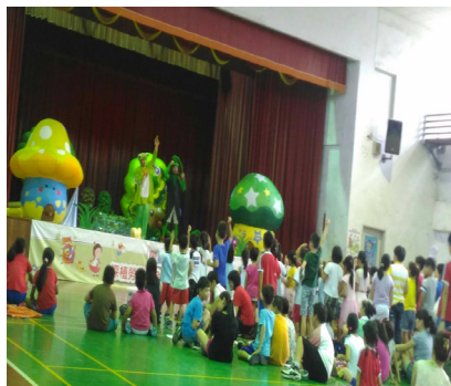
如果劇團到校宣導勞動教育，學生熱烈參與回答問題。