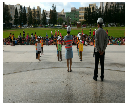
9月21日全校師生防災演練實況。

年級學生進行統一發票推行暨租稅教育宣導，透過話劇表演與有獎徵答方式，培養學生正確的納稅觀念及了解統一發票對國家建設的重要性。