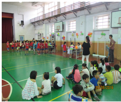
二、三年級學生參加英語閱讀認證活動。