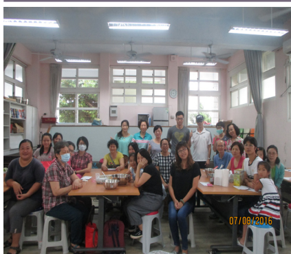
105社區多功能--烹飪班，大小朋友一起參加。