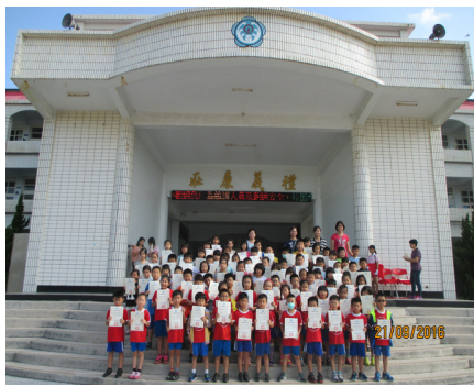
經典會考榮獲團體甲組第二名。