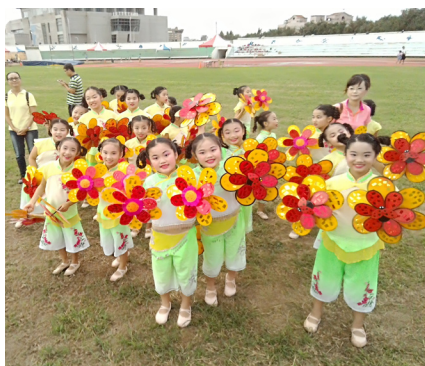
離島運動會開幕，舞蹈班應邀表演——浪花花，學生開心合影！