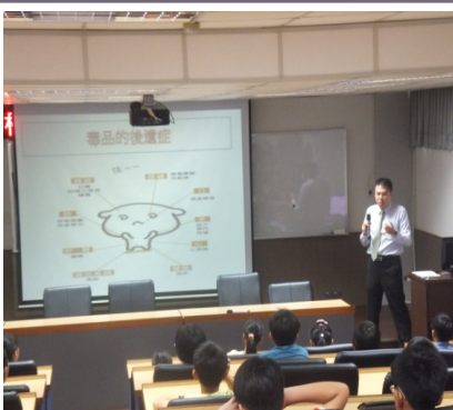
地檢署劉主任檢察官蒞校做校園法治教育宣導！