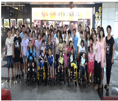
特殊教育班於馬公航空站舉辦藝術與人文作品聯展，與長官來賓家長合照。