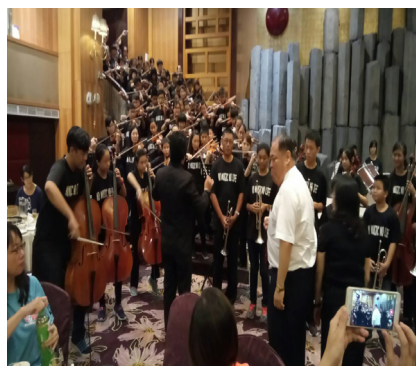
國際獅子會於特綜館舉行清寒獎學金捐贈典禮，音樂班熱情迎賓演出！