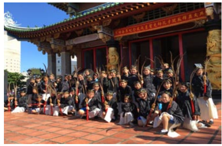
紀念至聖先師2567週年誕辰釋奠典禮 本校擔任六佾舞儀式。