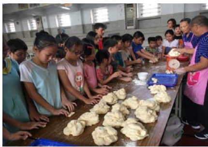
生命教育融入生活課程- 環島傳愛愛心饅頭活動