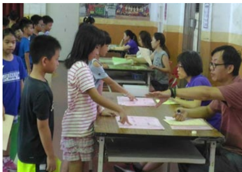
9月25日~9月30日進行英語闖關認證活動

七、10/12(四)澎湖縣政府稅務局蒞校對五年級學生進行統一發票推行暨租稅教育宣導，透過有獎徵答方式，培養學生正確的納稅觀念及了解統一發票對國家建設的重要性。