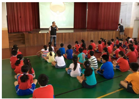
校外會的教官蒞校對師生進行反毒知識宣導