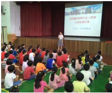
校長對全校師生進行友善校園宣導。