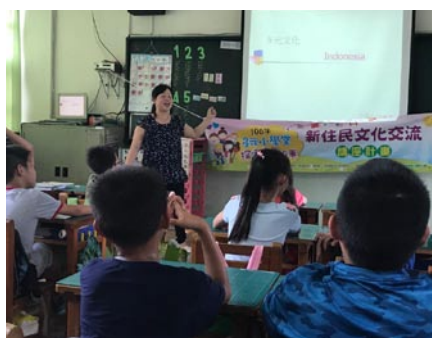
9月12日新住民中心入校進行多元文化宣導。