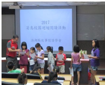
澎湖縣故事閱讀學會 在本校舉辦菊島文藝營活動