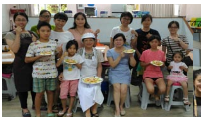
106社區多功能--烹飪班A，以及烹飪班B，大小朋友一起參加。