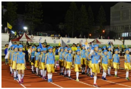
本校節奏樂隊在全縣運動會場上， 以整齊的步伐，引導各級學校運動員進場。