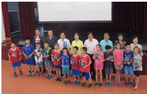
公共電視人文生態紀錄片《石居的春天》 首播發表會~10月17日在馬公國小舉行。