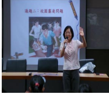
地檢署書記官長蒞校做校園法治教育宣導。