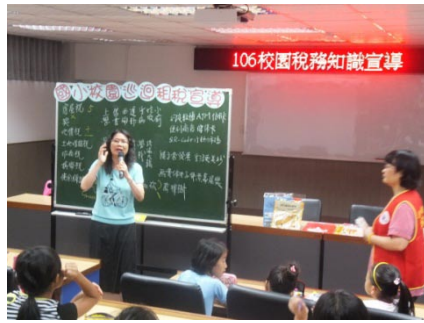
稅務局蒞校對五年級學生進行統一發票推行暨租稅教育宣導。