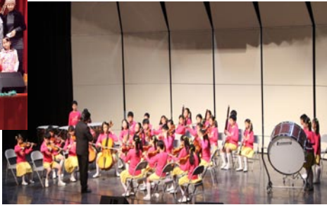
澎湖縣106學年度學生音樂比賽