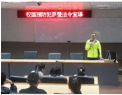
警察局少年隊蒞校進行校園預防犯罪暨法令宣導及有獎徵答活動