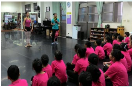
左營高中舞蹈班蒞校進行交流與示範