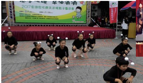
家扶中心「寒冬暖暖 幸福滿滿」義賣活動演出