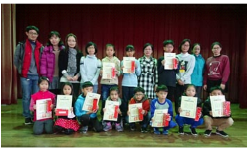
106年度全民國防教育徵畫暨書法比賽頒獎