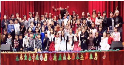
音樂班實習音樂會