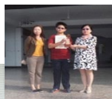
106年海洋知識PK賽頒獎