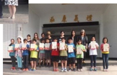
人權法治四格漫畫比賽頒獎