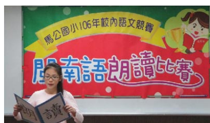
校內國語及閩南語朗讀比賽。