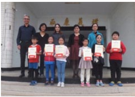
106年度防災教育四格漫畫比賽頒獎