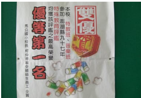
賀本校特教班及音樂班均獲96年度特殊教育評鑑優等第一名