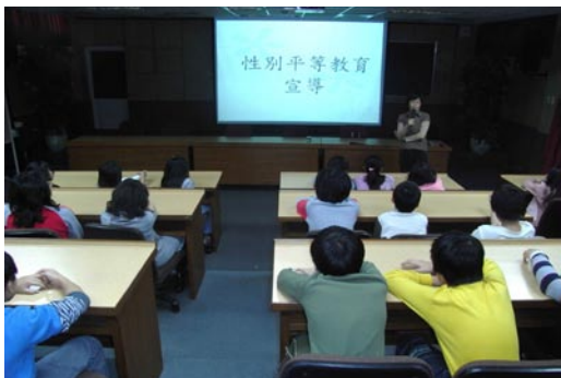
五年級於視聽教室參加性教育講座