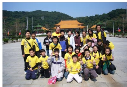
六年級畢業參訪活動—忠烈祠

近來放學時段家長機車停駐於東側門之情形已逐漸減少，但為避免阻塞放學路隊之路線，仍懇請接送孩子放學的家長能夠將您的機車停置於門口兩旁，勿直接停放於門口外，感謝您的配合。