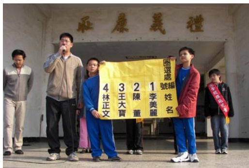
訓育組利用晨集時間進行民主法治教育