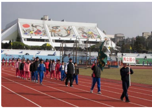
校長帶領校隊參加中小聯運開幕典禮