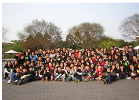
六年級畢業參訪活動—六福村主題遊樂園

為了維護孩子們在校園的安全活動，請您早上載送小朋友到校時，請勿將機汽車行駛進入校園中。因為在那時候，小朋友正在校園中遊戲活動或從事公共區域的打掃工作，若您將汽、機車駛入校園中，容易影響學童活動安全。建議您可將孩子載送至學校的大門或東西側門口，讓小朋友自己步行進入教室，感謝您的幫忙！