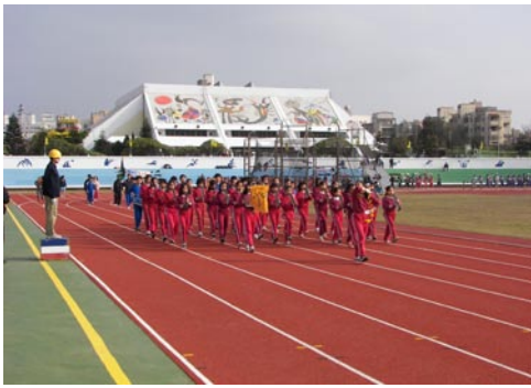
本校直笛節奏樂隊擔任中小聯運校隊前導