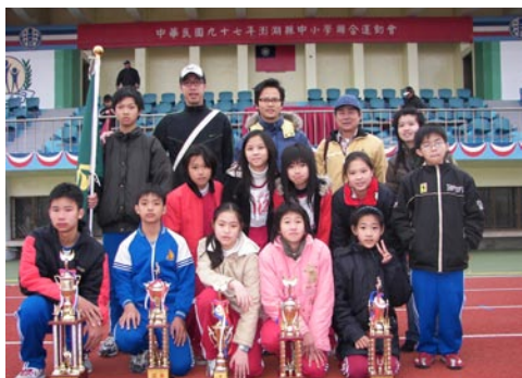
田徑校隊於中小聯運獲得多項佳績

本校校園進行美化綠化工作，栽種許多盆栽，也灑草籽，期待校園更美更好，最近更著手校園植物牌的製