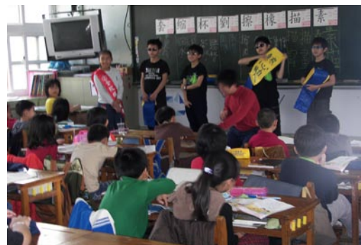
全校模範兒童候選人至各班進行拉票活動