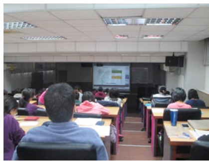
週三進修教師參加『MAKER自造未來』影片欣賞。