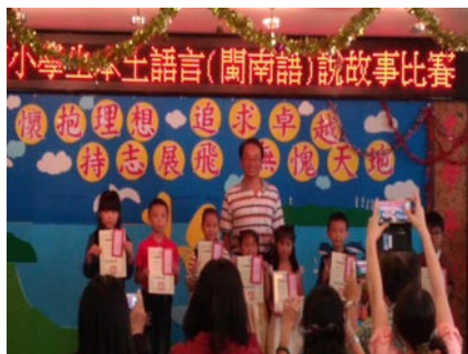
國小「閩南語說故事」比賽獲獎同學合影。