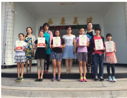
全縣人權法治教育四格漫畫比賽得獎同學合影。