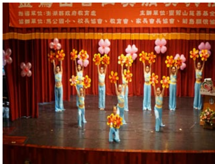
五年舞蹈班於「普仁獎頒獎典禮」表演—菊島愛飄揚。