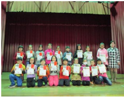
校內國語朗讀比賽獲獎同學。