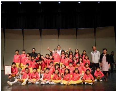
音樂班管絃樂比賽榮獲優等佳績開心合影。