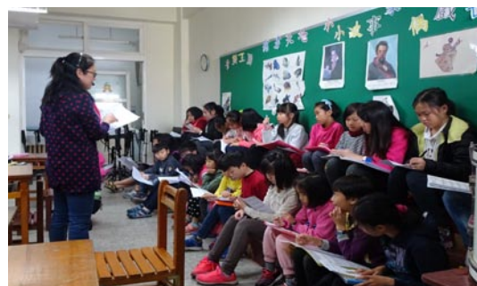
全縣音樂與表演冬令營C組上課情形

七、地球約只有百分之一的生命所需淡水，澎湖更是缺水地區，平日珍惜水資源。另外，水利署網站提供省水好習慣課後習作及貼紙、磁鐵等宣導文宣可供索取。為教導孩子做到家庭省水，也發下「十大省水好習慣學習單」，讓孩子帶回家紀錄，大家一起為節水努力。