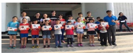
班級模範兒童與特殊優良事蹟模範兒童頒獎