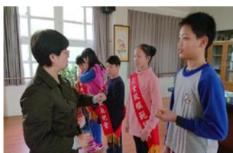
全校模範兒童選舉活動~抽號次、披彩帶。