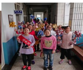
下課時間，候選人積極拉票。