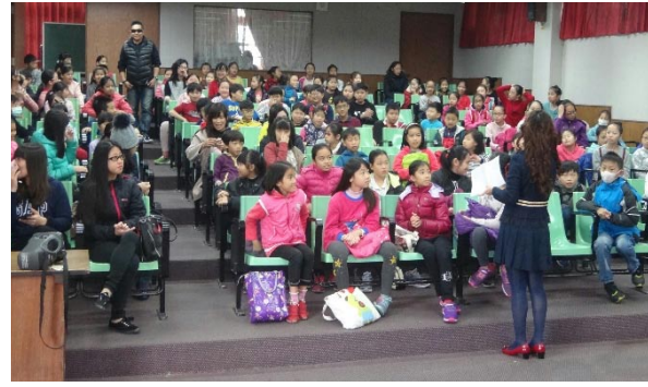
全縣音樂與表演冬令營始業式