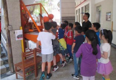
小朋友參加宣導活動