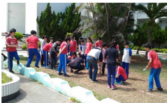
四健會指導學生栽種向日葵

九、感謝家長會贊助經費辦理愛心玩遊會，每生獲贈10元玩遊券；活動結束後，將於運動會捐贈家扶中心、集愛工坊及小布廚房各7650元，感謝親師生的愛心。