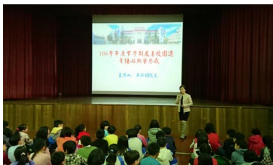
校長進行友善校園週宣導，強調反毒、反黑、反霸凌的重要。