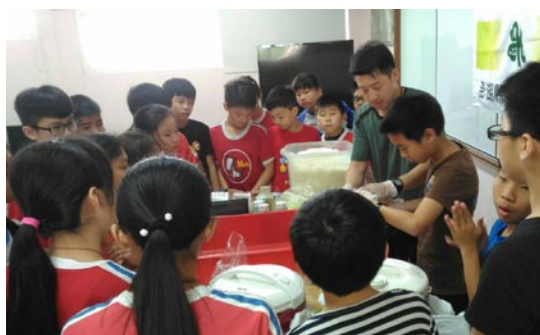
握壽司與烤飯糰製作