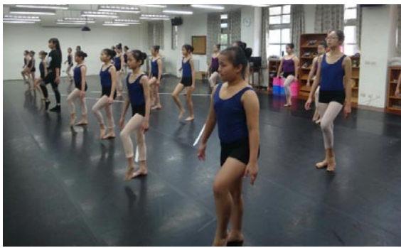
全縣音樂與表演冬令營B組上課情形