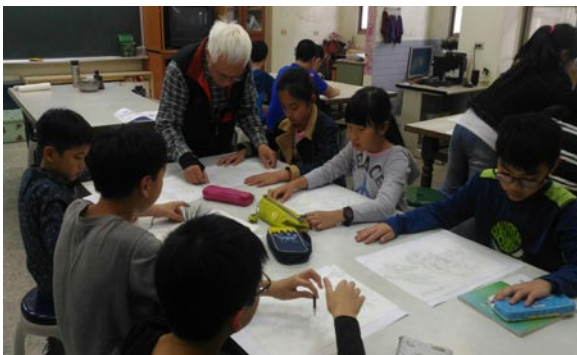
藝術深耕計畫學生學習水墨畫