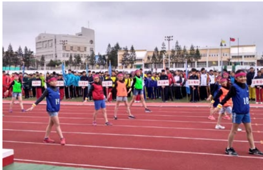
澎湖縣中小學聯運開幕典禮進場表演