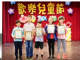
107年度全縣模範兒童表揚大會