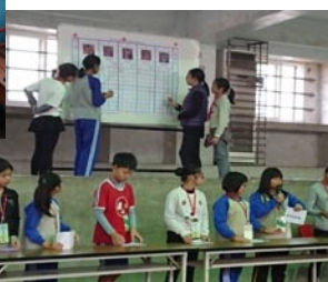
全校模範兒童投票、開票情形。