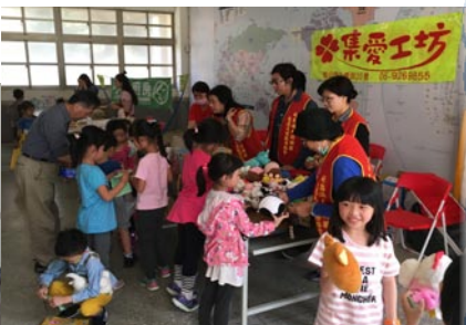
小朋友逛玩遊會，真開心！