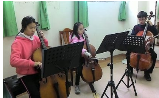
全縣音樂與表演冬令營A組上課情形