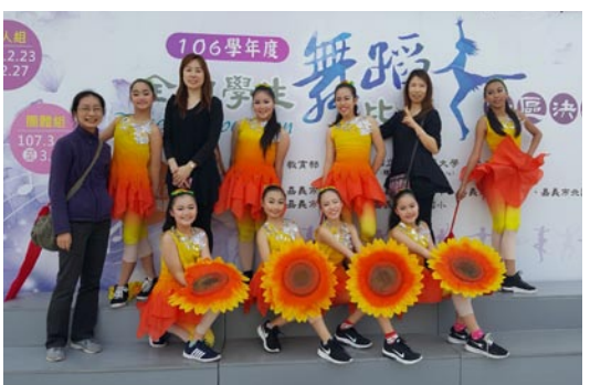
106學年度全國舞蹈比賽