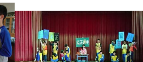
班上助選員輪番上陣推薦候選人